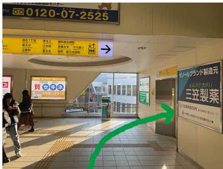
②少し進むと右手に見えてくるエレベーターで1階におります