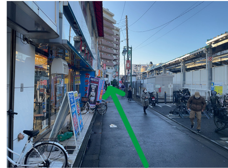
④カラオケ館を左手に通り過ぎ、線路沿いをまっすぐ行きます