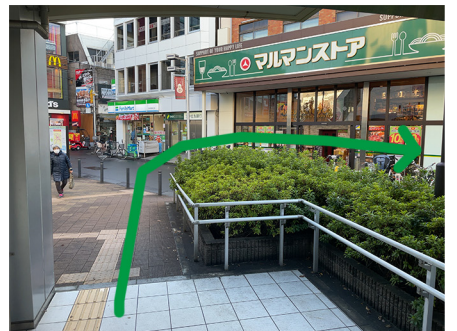
③スーパーの「マルマン」の前を右手に。線路沿いにいきます