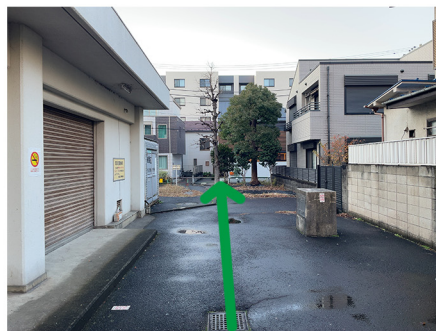
⑦消防用地を通り抜けますが、もうその向こう側に、見えています!