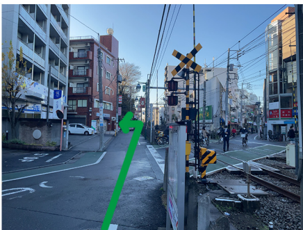
⑤右手に踏切を通り過ぎ、突き当たりの神社の入り口手前を左に折れます