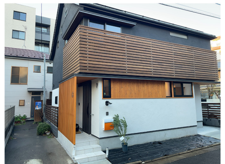
⑧これが楽ゆる整体です。オレンジのポストが目印です。インターホンを鳴らしてください!