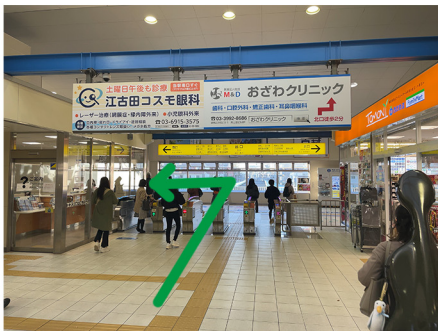
①江古田駅改札を出て左へ