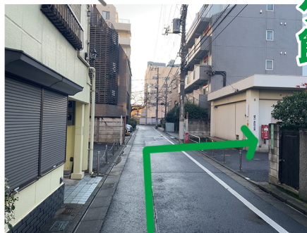
⑥少だけ歩くと左手に床屋さん、右手に空き地 (消防用地) があり、そこで右へ